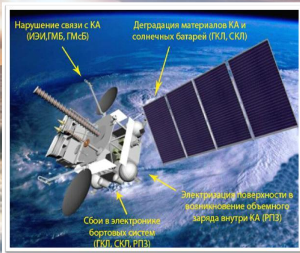
Метеорологический ИСЗ «Электро-Л»